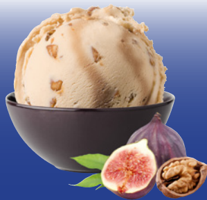
51852 Walnuss Feige 750 ml 6,75 € 1 L=9,00