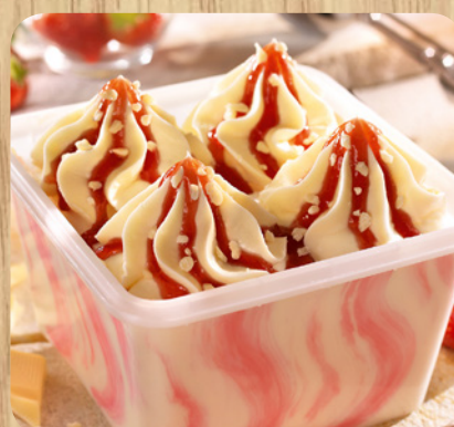
28558 Spaghettino 1000 ml 6,75 Euro