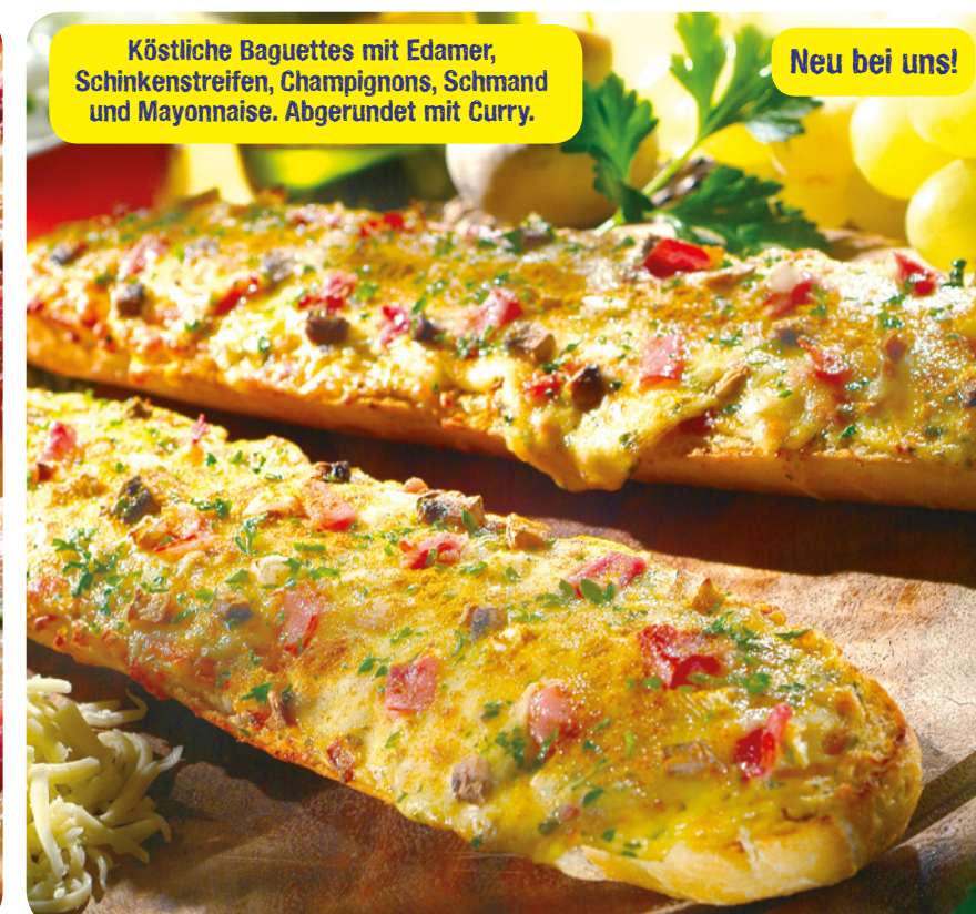
57041 Winzer Baguette 4 St./680 g (1 kg=16,10) 10,95€