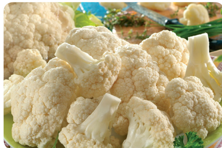
52134 Blumenkohl 1200 g (1 kg=6,54) 7,85 €