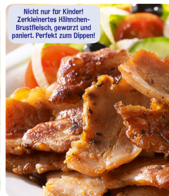
54092 Chicken Nuggets 800 g (1 kg=13,69) 10,95 €

Nicht nur für Kinder! Zerkleinertes Hähnchenbrustfleisch, gewürzt und paniert. Perfekt zum Dippen!