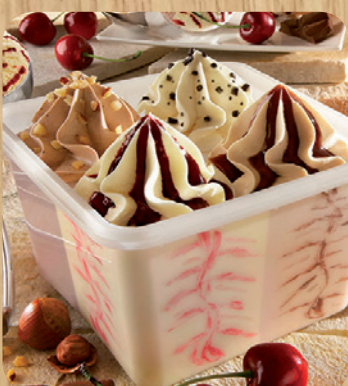
81400 Quartetto 1000 ml 6,75 Euro