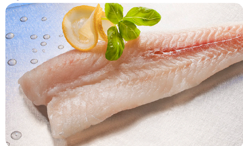
3117 All-Fisch Alaska Seelachsfilet 750 g (1 kg=7,93) 5,95 €