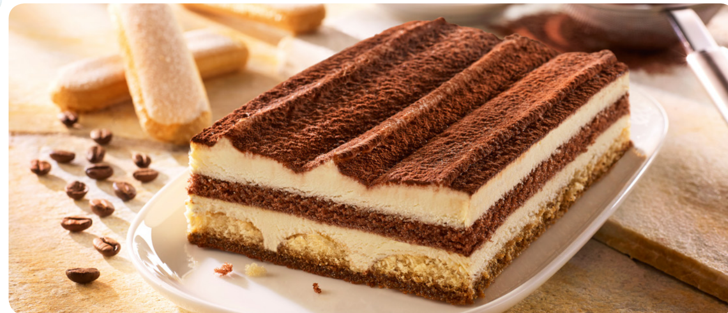
59561 Original ital. Tiramisu 500 g (1 kg=18,80) 9,40 €