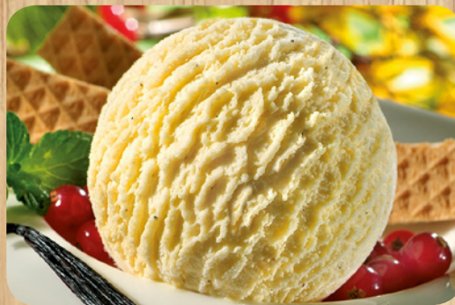
81114 Vanille Bourbon 1000 ml 6,75 Euro