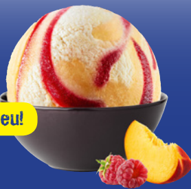
Bourbon-Vanille mit Pflirsich-Sorbet