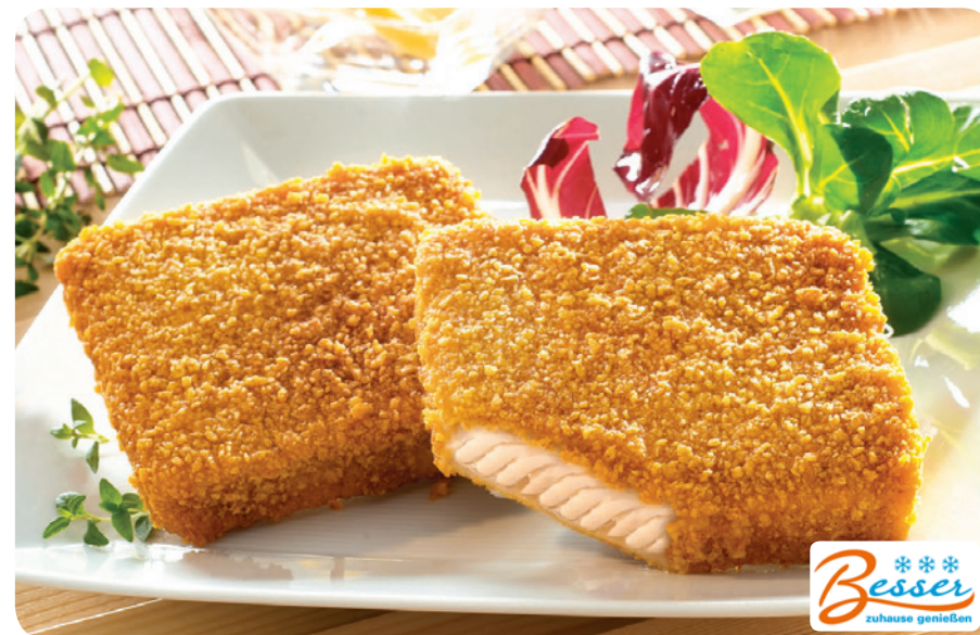
56008 Eismeer-Filetten 1050 g (1 kg=13,95) 14,65 €