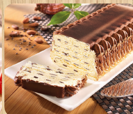
51581 Knusperrolle Vanille 1000 ml 5,75 Euro