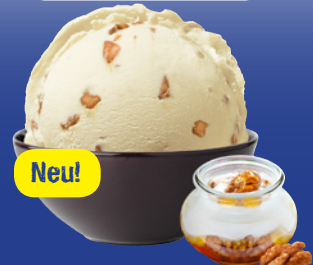
Löffelzarte Joghurt-Eiscreme mit Honigsauce & karamelli- sierten Walnüssen