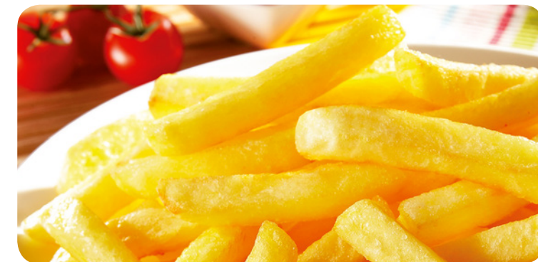
53657 Friteusen Pommes Frites 1200 g (1 kg=3,04) 3,65 €