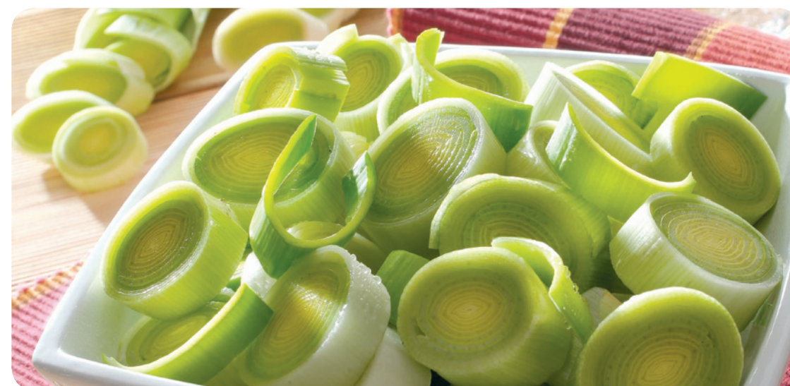
52123 Porree 1000 g 3,95 €