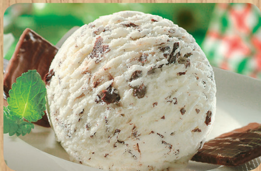
51182 Stracciatella 1000 ml 6,75 Euro