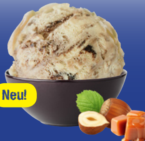
Cremige Karamell- & Haselnuss-Eiscreme