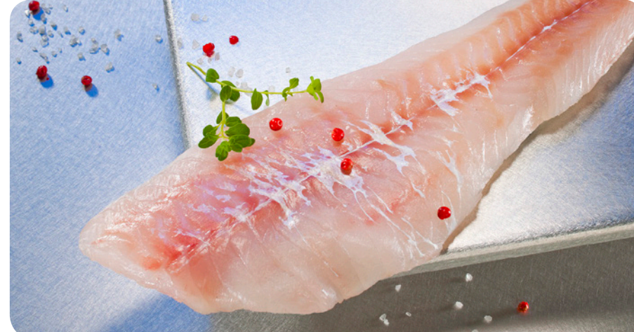
3126 All-Fisch Kabeljau-Filet 1000 g 11,50 €