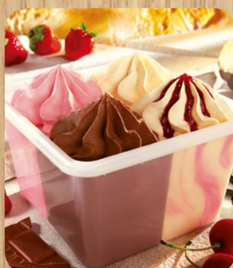
81403 Viererlei 1000 ml 6,75 Euro