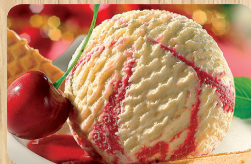
51151 Amarena 1000 ml 6,75 Euro