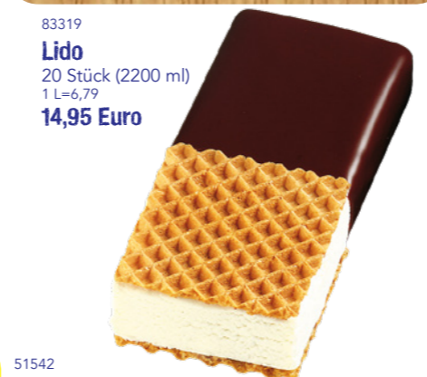
83319 Lido 20 Stück (2200 ml) 1 L=6,79 14,95 Euro