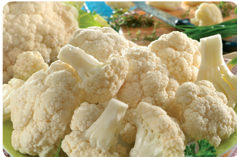
52134 Blumenkohl 1200 g (1 kg=7,04) 8,45 €