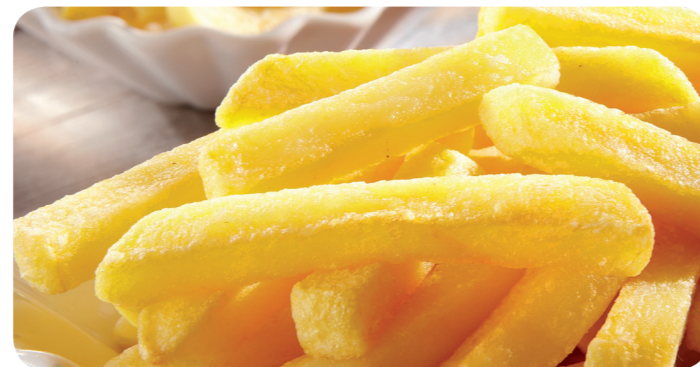
53248 Backofen Frites 1200 g (1kg=4,79) 5,75 €