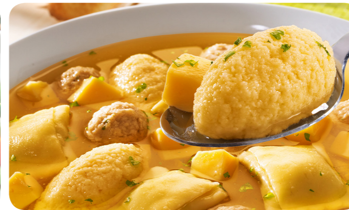
57484 Hochzeitssuppen-Einlage 1000 g 9,95 €