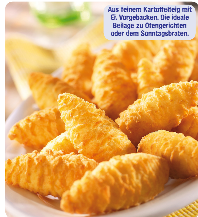
53007 Backofen Krokett Zapfen 1500 g (1 kg=5,63) 8,45 €

Aus feinem Kartoffelteig mit Ei. Vorgebacken. Die ideale Beilage zu Ofengerichten oder dem Sonntagsbraten.