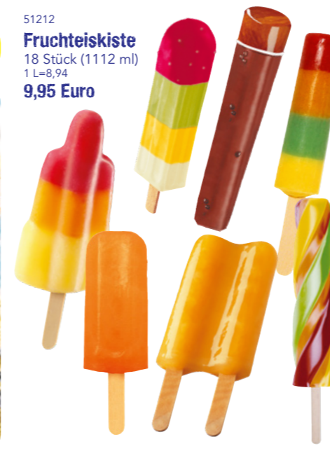
51212 Fruchteiskiste 18 Stück (1112 ml) 1 L=8,94 9,95 Euro