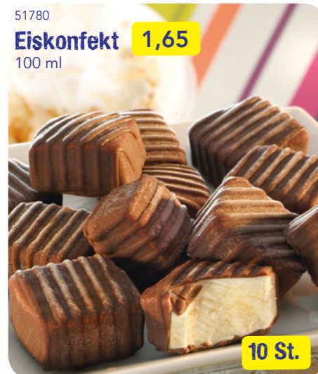
51780 Eiskonfekt 1,65 100 ml