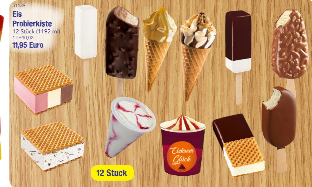
51139 Eis Probierkiste 12 Stück (1192 ml) 1 L=10,02 11,95 Euro