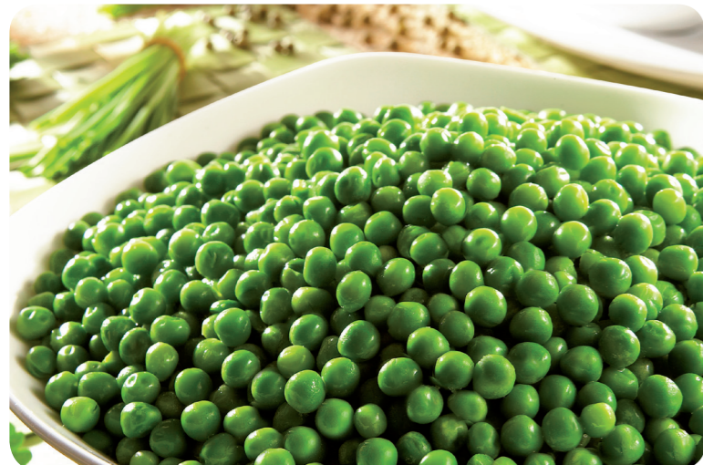
52135 Erbsen, extra fein 1200 g (1 kg=6,21) 7,45 €