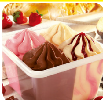
81403 Viererlei 1000 ml 6,95 Euro