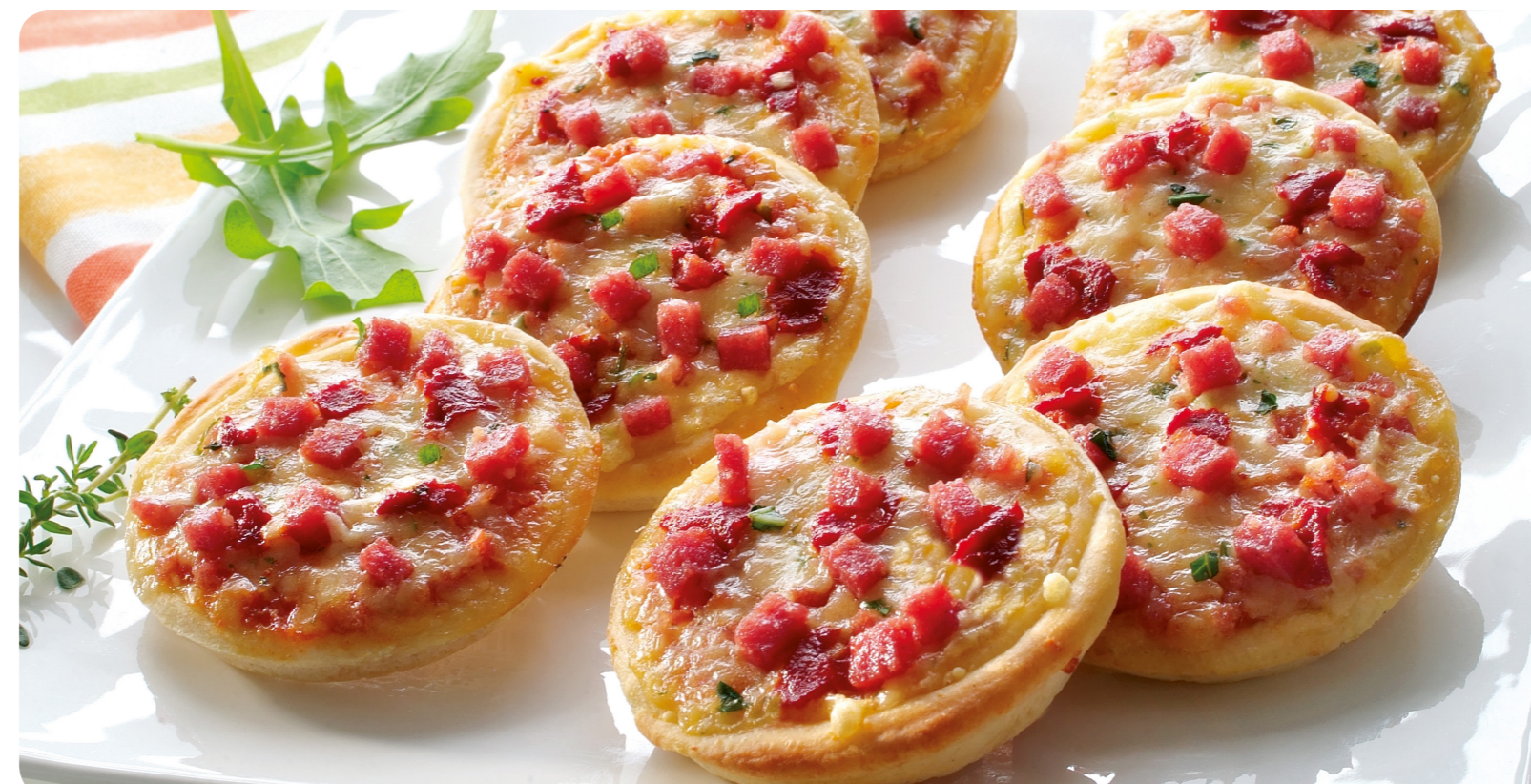
54780 Piccolini Salami 18 St./540 g (1 kg=19,35) 10,45€

Ein leichtes Gericht: Nudeln, frische Erbsen, Tomaten, Mais, Zwiebeln, Champignons, Paprika und Hackfleisch.