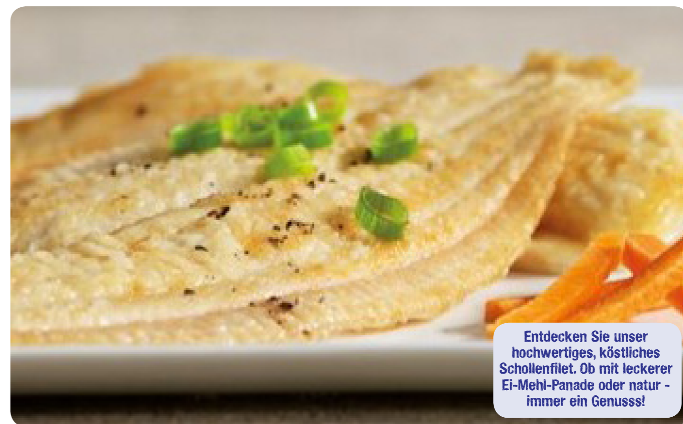
28784 Kramers Seafood Schollenfilets 640 g (1 kg=13,90) 17,95 €