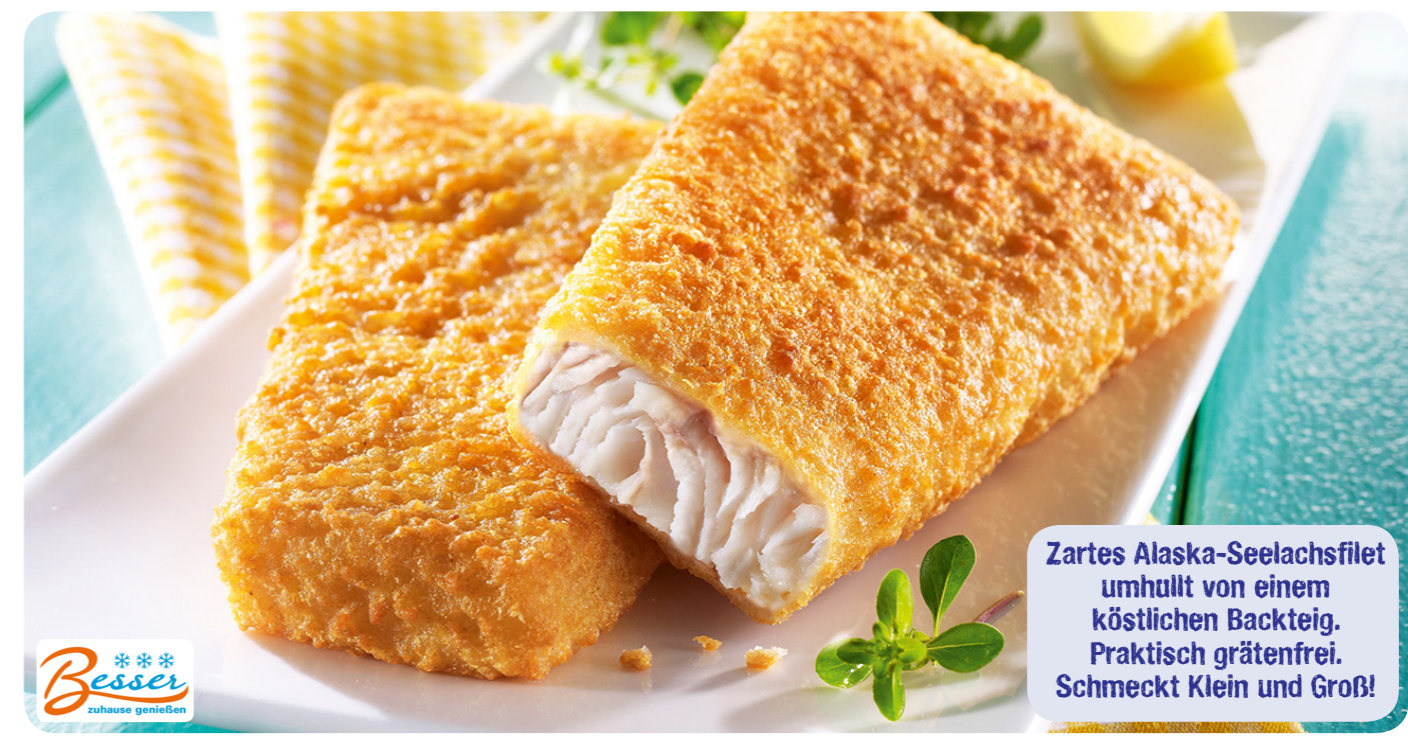
56279 Backfisch „Gourmet“ 960 g (1 kg=16,61) 15,95 €