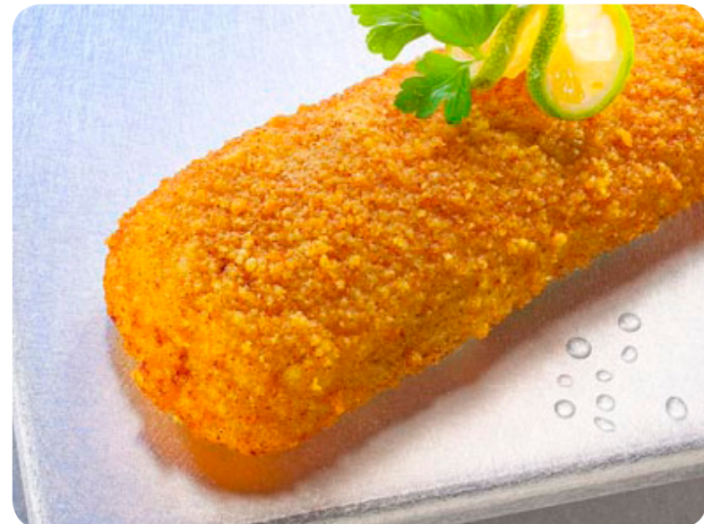
3105 Alaska Seelachsfilet in Knuspermarinade 1,5 kg 16,95 € (1 kg=11,30)

Fangfrischer Fisch in TK-Top-Qualität - lecker!