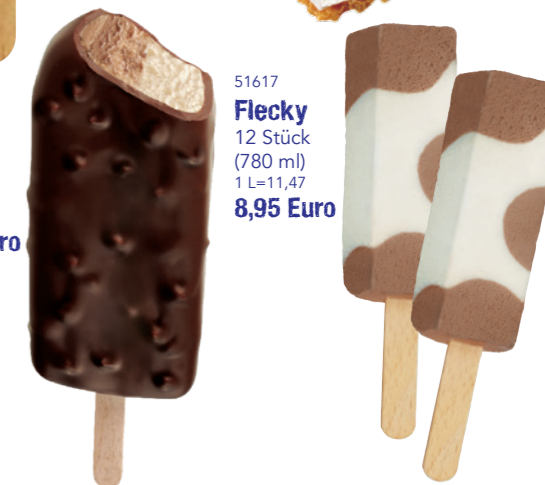
51617 Flecky 12 Stück (780 ml) 1 L=11,47 8,95 Euro