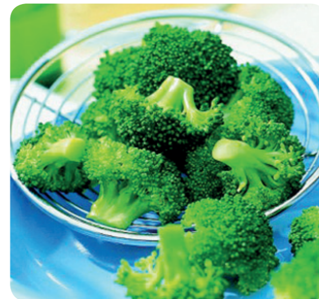
52032 Broccoli 1200 g (1 kg=7,46) 8,95 €