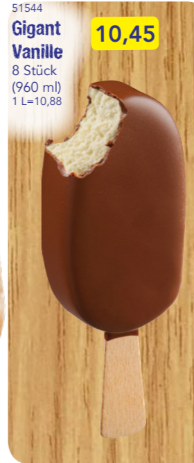
51544 Gigant Vanille 10,45 8 Stück (960 ml) 1 L=10,88