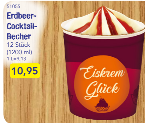
51055 Erdbeer-Cocktail-Becher 12 Stück (1200 ml) 1 L=9,13 10,95