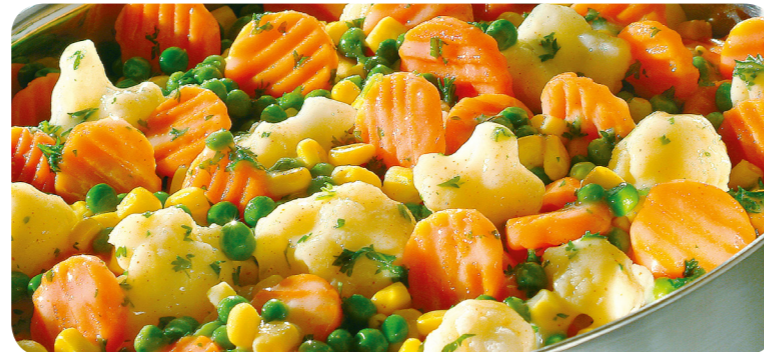
52028 Buttergemüse 1000 g 7,95 €