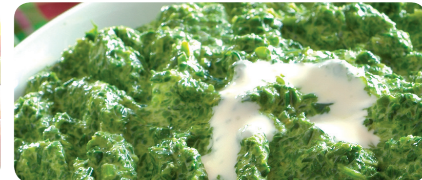
52131 Rahm-Spinat 1000 g 5,95 €