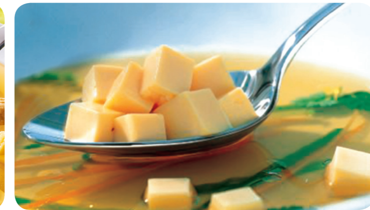
57479 Eierstich 750 g (1 kg=13,27) 9,95 €

Aus feinem Kartoffelteig mit Ei. Vorgebacken. Die ideale Beilage zu Ofengerichten oder dem Sonntagsbraten.