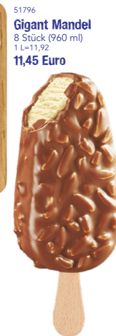
51796 Gigant Mandel 8 Stück (960 ml) 1 L=11,92 11,45 Euro