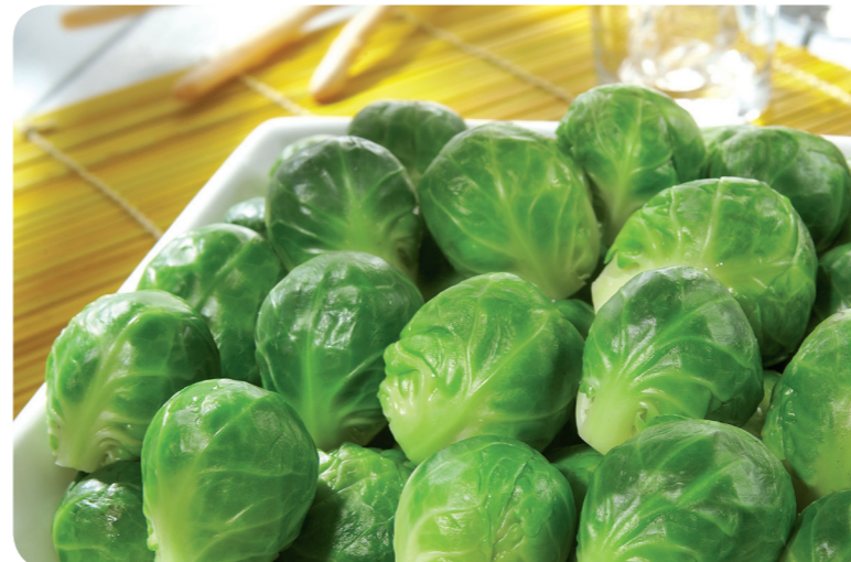
52140 Rosenkohl 1200 g (1 kg=6,21) 7,45 €