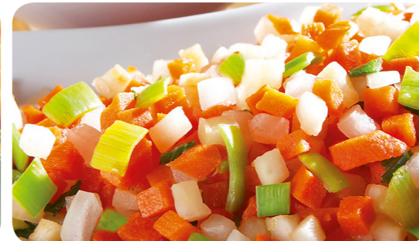
52184 Bouillon Gemüse 1000 g 5,95 €