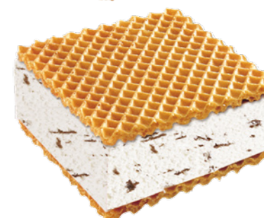
51758 Stracciatella Schnitte 12 Stück (1440 ml) 1 L=6,56 9,45 Euro