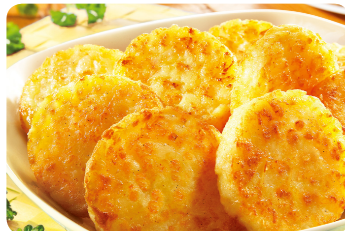
53014 Backofen Röstinchen 1500 g (1 kg=5,63) 8,45 €