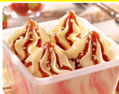
28558 Spaghetтино 1000 ml 6,95 Euro