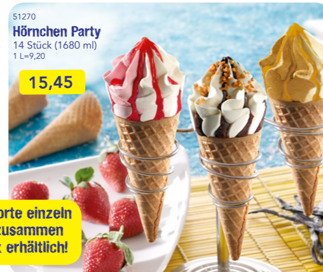
51270 Hörnchen Party 14 Stück (1680 ml) 1 L=9,20 15,45

Jede Sorte einzeln oder zusammen als Mix erhältlich!