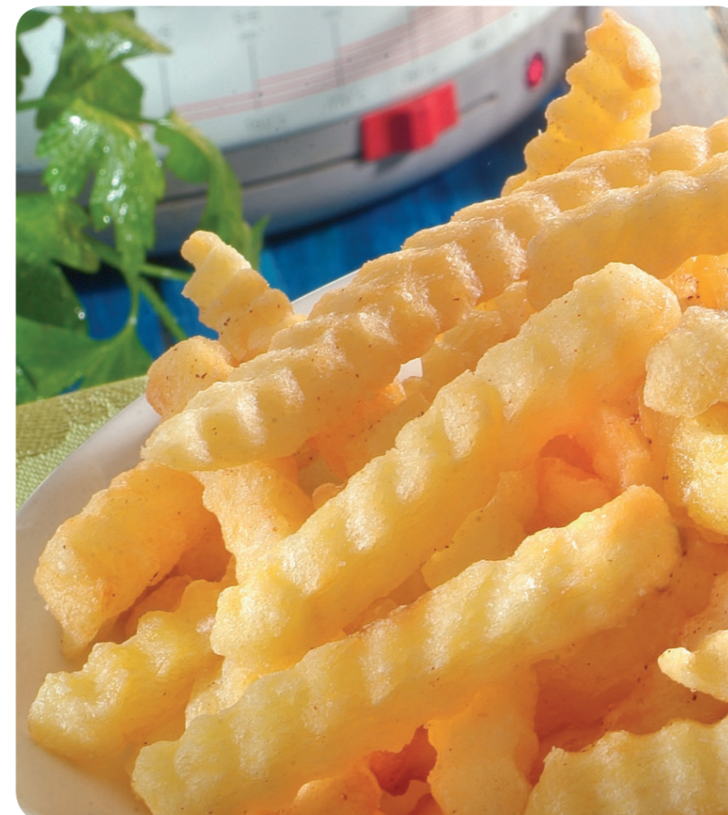
53660 Backofen Kringle-Frites 1200 g (1kg=4,96) 5,95 €