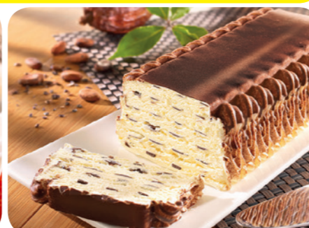
51581 Knusperrolle Vanille 1000 ml 7,45 Euro