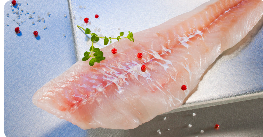
3126 All-Fisch Kabeljau-Filet 1000 g 11,90 €