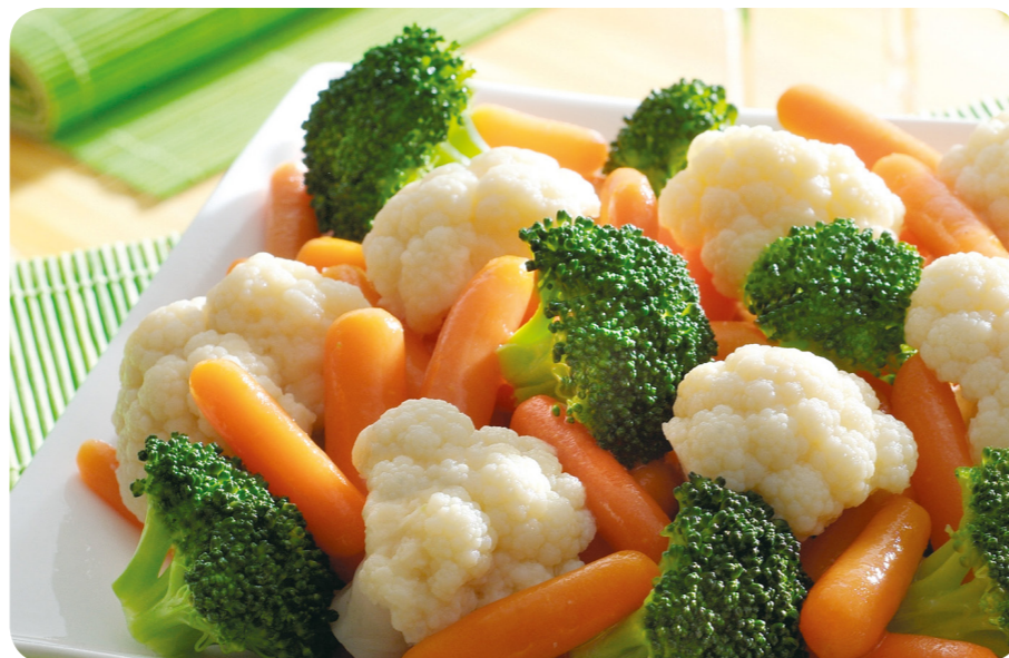
52011 Kaisergemüse Exquisit 1200 g (1 kg=7,46) 8,95 €