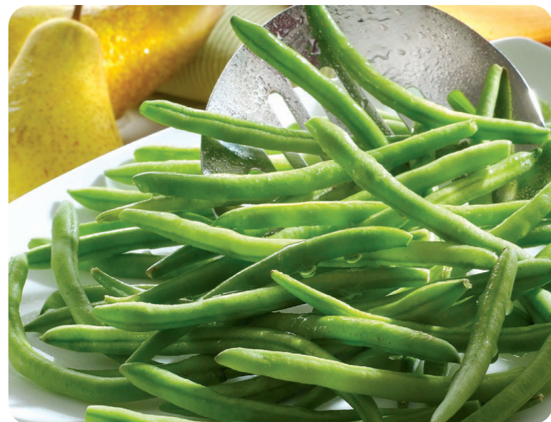
52126 Prinzessbohnen 1200 g (1 kg=7,46) 8,95 €