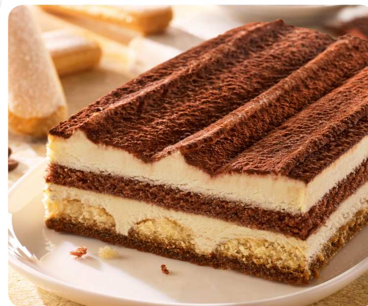
59561 Original ital. Tiramisu 500 g (1 kg=18,90) 9,45 €