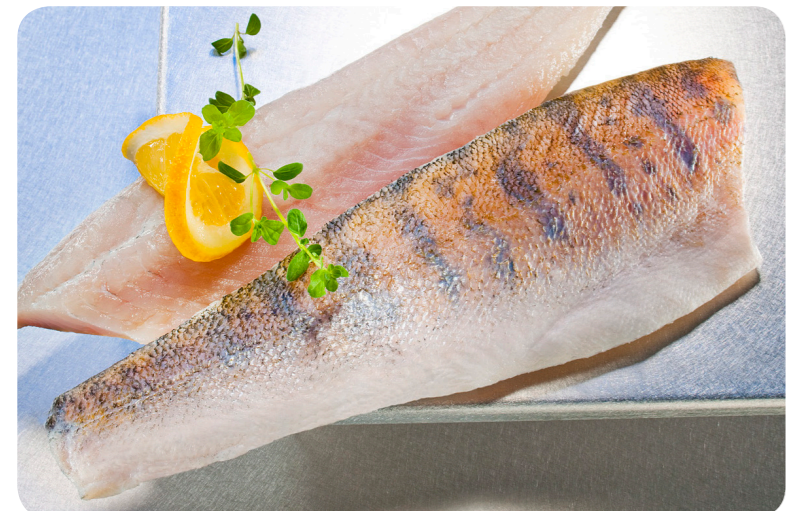
3101 All-Fisch Zanderfilet 1000 g 17,95 €