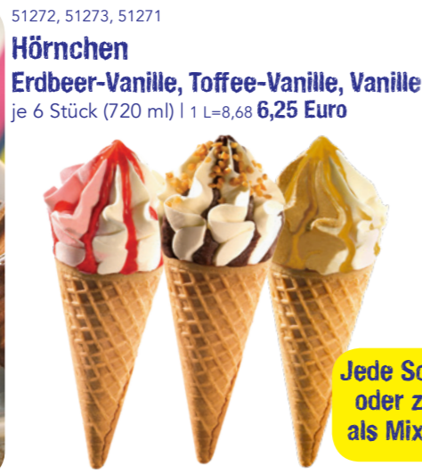
51272, 51273, 51271 Hörnchen Erdbeer-Vanille, Toffee-Vanille, Vanille je 6 Stück (720 ml) | 1 L=8,68 6,25 Euro

Jede Sorte einzeln oder zusammen als Mix erhältlich!