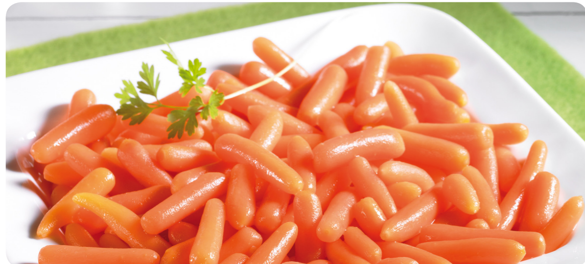
52147 Fingermöhren 1200 g (1 kg=6,63) 7,95 €