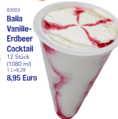
83003 Balla Vanille-Erdbeer-Cocktail 12 Stück (1080 ml) 1 L=8,28 8,95 Euro