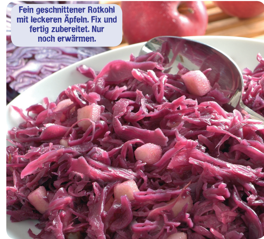
52188 Apfel-Rotkohl 1500 g (1 kg=6,30) 9,45 €

Fein geschnittener Rotkohl mit leckeren Äpfeln. Fix und fertig zubereitet. Nur noch erwärmen.