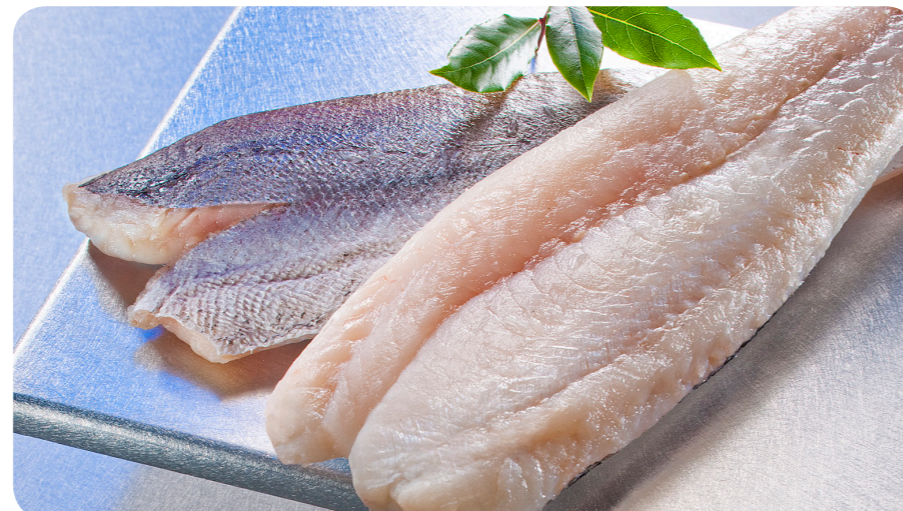
3103 All-Fisch Kap-Seehecht-Filet 1000 g 11,95 €