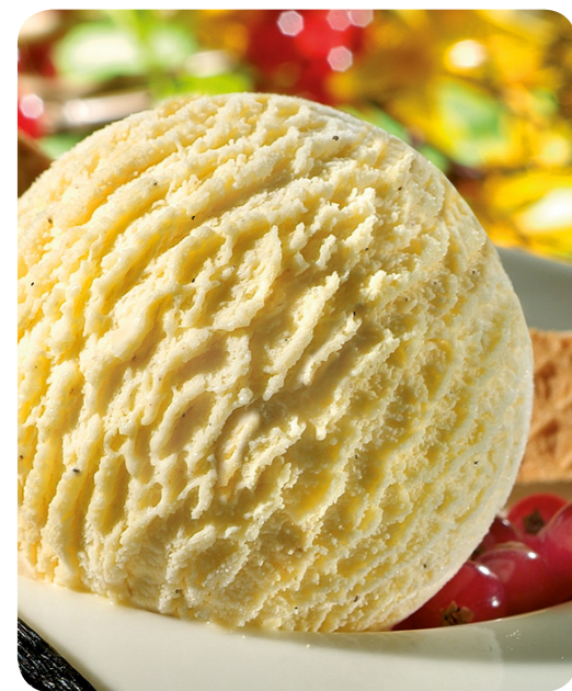
81114 Vanille Bourbon 1000 ml 6,95 Euro 81151 Amarena 1000 ml 6,95 Euro 51182 Stracciatella 1000 ml 6,95 Euro