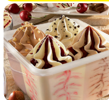
81400 Quartetto 1000 ml 6,95 Euro