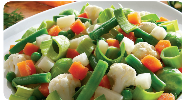
52014 Suppengemüse 1200 g (1 kg=4,96) 5,95 €