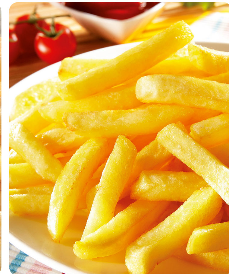
53657 Friteusen Pommes Frites 1200 g (1 kg=4,13) 4,95 €